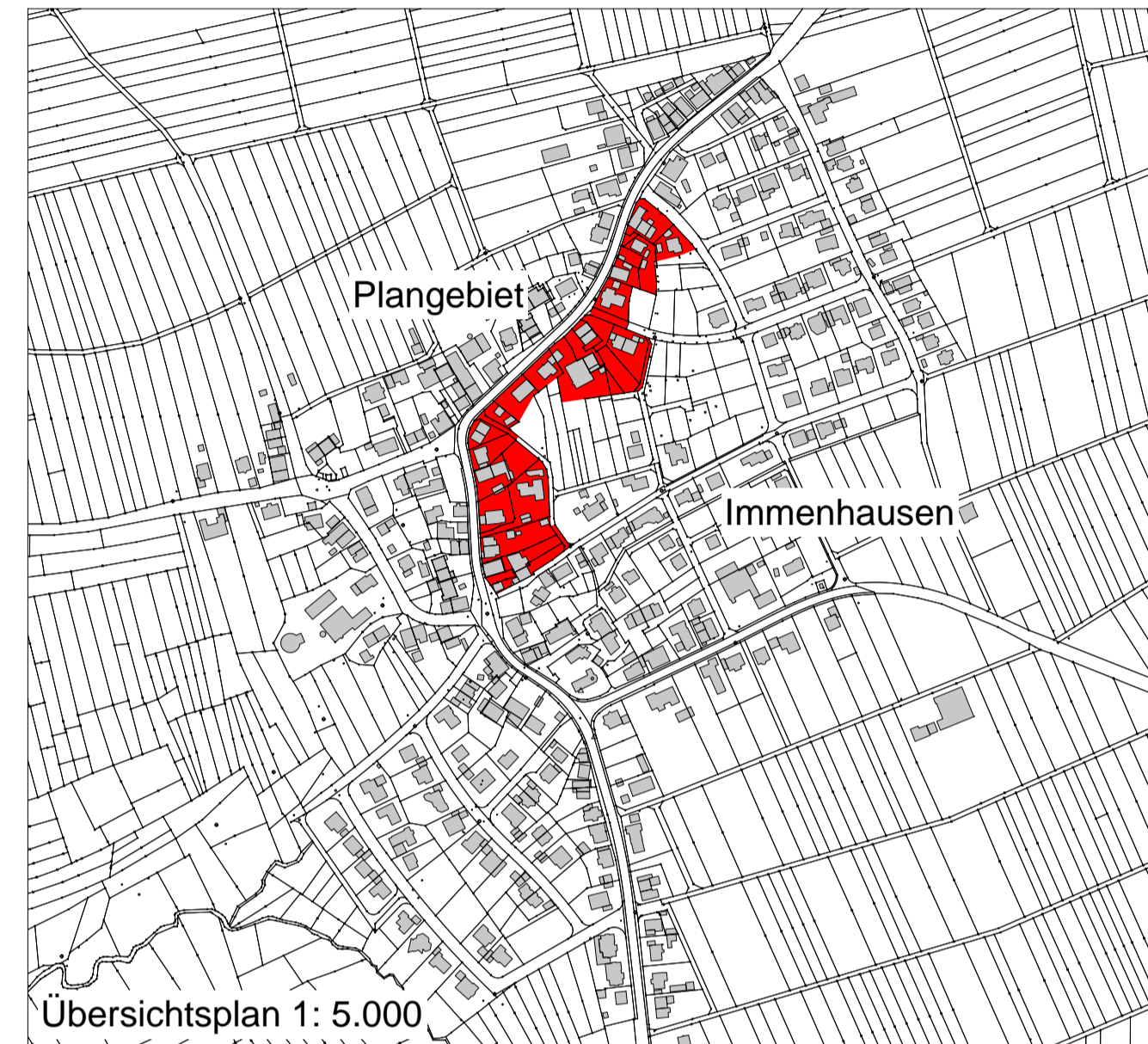
Übersichtsplan 1: 5.000

█ Grenze des räumlichen Geltungsbereichs der Örtlichen Bauvorschriften (§ 74 (6) LBO)